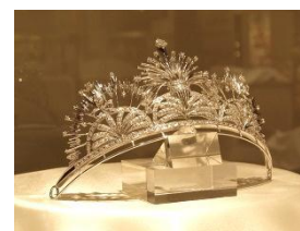
6,000万円相当の豪華ティアラ

《当日成約特典①》：挙式当日、豪華ダイヤモンドティアラを無料でレンタルしていただけます。(5組限定)