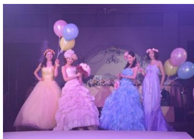
ドレスファッションショーイメージ

フェア当日は、ガールズコレクションのトップモデル達が最新のドレスを身にまとい、華麗なショーを展開します。