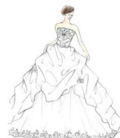
オリジナルドレスイメージ