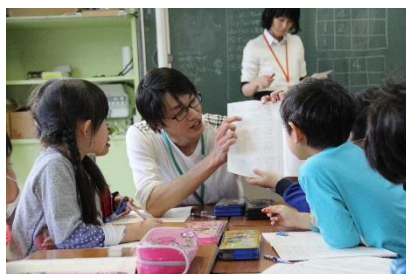
小学生の授業の様子

かねてよりエコキャップ運動やオレンジリボン運動などを通じて、地域・社会貢献活動をしてきたオリエンタルホテル 東京ベイでは、今後も活動を続けてまいります。