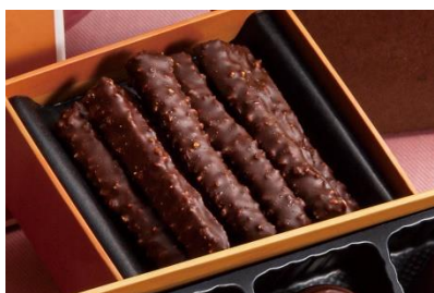
オレンジジェットギフト ボックス入り 900 円 7本セット 400 円

シロップ漬けたオレンジピールをチョコレートでコーティング。 ピールの苦みとチョコレートの甘さの絶妙なハーモニーは、大人向けの味わい。