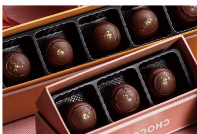
ショコラロワイヤル ボックス入り 5 個セット 980 円 ボックス入り 3 個セット 660 円

シロップ漬けたオレンジピールをチョコレートでコーティング。 ピールの苦みとチョコレートの甘さの絶妙なハーモニーは、大人向けの味わい。