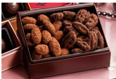
ダブルショコラギフト ボックス入り 900 円